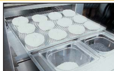
Vorbereitungslade mit 2 Schütten