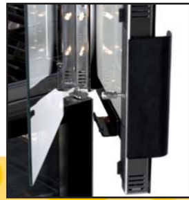
einfach zu wechselnde Halogenbeleuchtung