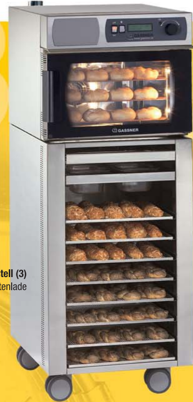
Untergestell (3) mit Zutatenlade