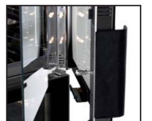
leicht zu reinigende Doppelglastür