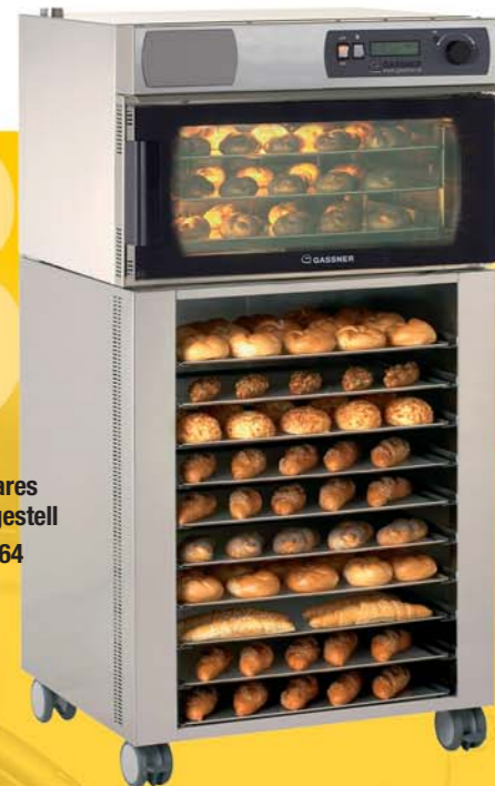
Fahrbares Untergestell FU 10.64