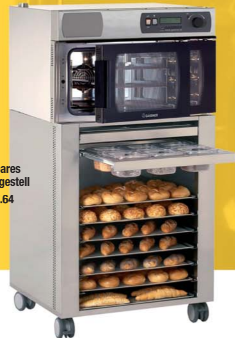
Fahrbares Untergestell FUL 7.64