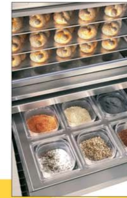
Zutatenlade mit 6 Gefäßen