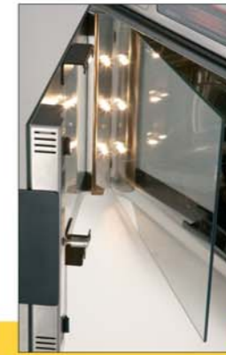
Einfach zu wechselnde Halogenbeleuchtung