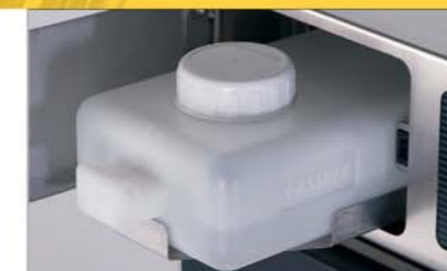
Integrierter Wassertank auf Lade.

*Die Sonderfarben beziehen sich auf die Frontscheibe.