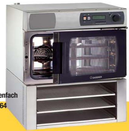
Etagenfach ET 3.64